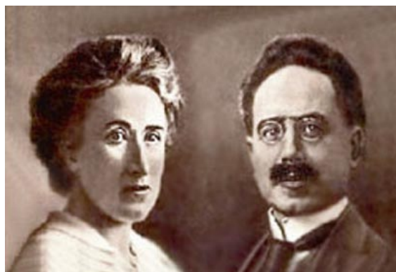
Rosa Luxemburgo y Carlos Liebknecht