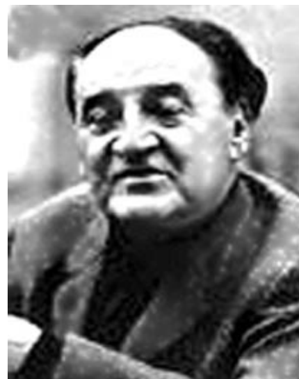
Víctor R. Haya de la Torre

APRA. (Alianza Popular Revolucionaria Americana). Se fundó en 1924 como un "gran frente único antiimperialista". Su jefe, Víctor Raúl Haya de La Torre, la definió como el "Partido revolucionario internacional antiimperialista". Pretextando el atraso de los países del Continente se estructuró, a semejanza del Kuomintang chino, no como partido clasista, sino como un frente único de las cuatro clases. En los años treinta tuvo mucha influencia sobre el movimiento socialista boliviano. Algunos grupos se declararon francamente apristas. En 1935, el Partido Comunista peruano propuso al APRA constituir el frente popular y la respuesta fue que la organización timoneada por Haya de la Torre era ya eso. Su planteamiento: la emancipación nacional del yugo imperialista y la unificación económica y política indoamericana. La revolución proletaria vendrá después. El imperialismo es la última etapa del capitalismo en los pueblos industriales, pero representa en los nuestros la primera etapa. Nuestro capitalismo nace con el advenimiento del imperialismo. Nace, pues, dependiente, y como resultado de la culminación del imperialismo en Europa y en los Estados Unidos". Durante la segunda guerra mundial se alineó junto a Norte América. Concluye como francamente pro-imperialista. No oculta sus simpatías hacia el MNR. En las elecciones peruanas de 1985 alcanzó la victoria.